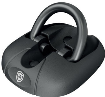
advanSecure® Wand- und Bodenanker

Auch zuhause sollten Sie Ihr wertvolles Zweirad unbedingt abschließen und sichern. Zweiräder werden immer häufiger auch aus abgeschlossenen Schuppen, Kellern oder Garagen gestohlen, die nur wenig Schutz bieten. Auch wenn das Zweirad abgeschlossen ist, kann es durch Diebe dennoch leicht weggetragen und in ein Fahrzeug geladen werden. Gleiches gilt für Zweiräder, die vor einem Gebäudeeingang abgeschlossen werden, wo es keinen festen Fahrradständer