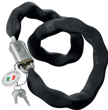
advanSecure® Kettenschloss, Modellreihe „Hammerburg“

Schließen Sie Ihr Fahrrad an einer gut beleuchteten Stelle mit hoher Passantenfrequenz und möglichst in der Nähe anderer Zweiräder ab. Stellen Sie das Fahrrad nicht immer an derselben Stelle ab.